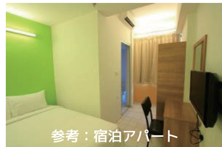
参考：宿泊アパート